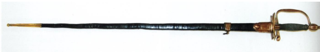
■ Épée des officiers des troupes à pied modèle 1767 attribuée à un officier de marine. Conservatoire des uniformes de la Marine.

Extrait de la revue La gazette des uniformes n°65