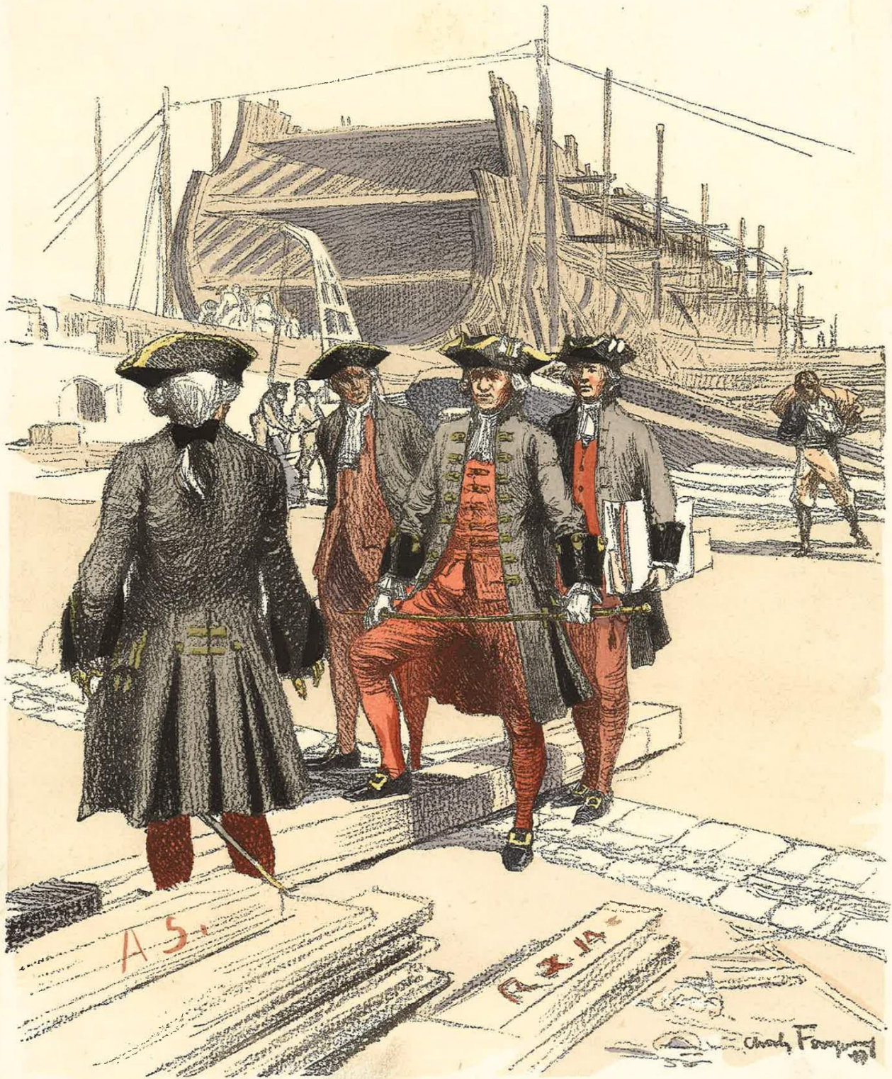
INGÉNIEURS-CONSTRUCTEURS GRAND UNIFORME (Ordonnance du 15 Mars 1765)