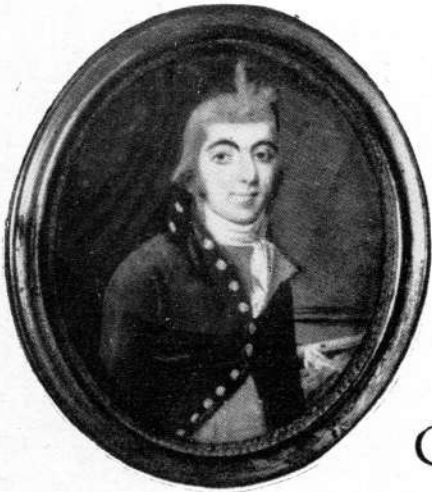
Officier du Corps du Génie Maritime Chef de Construction (1800).