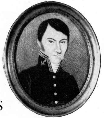
Sous-Ingénieur de 3 e classe du Génie Maritime, vers 1830.