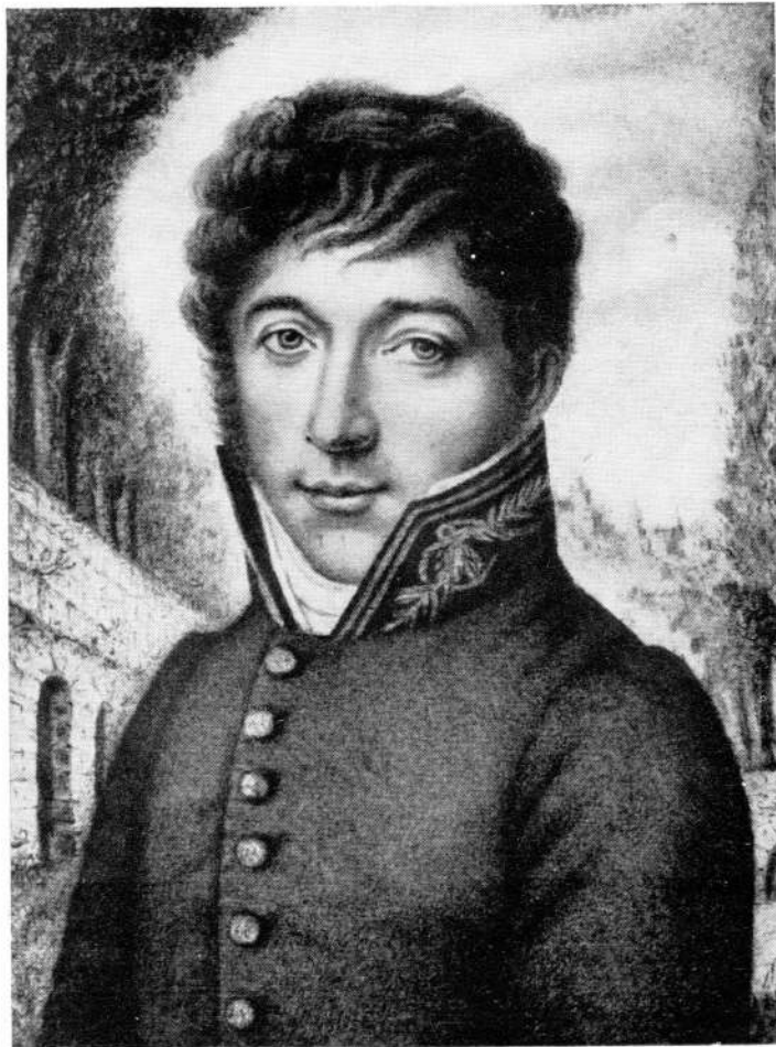
Sous-Ingénieur du Génie Maritime détaché dans une Direction forestière - 1830

Et nous voici au début du XIX e siècle. Le Consulat, le 7 Fructidor an 8 (25 août 1800) prend un Arrêté général relatif à l'uniforme de tous les Officiers de la Marine. Cette fois nos Ingénieurs-Constructeurs porteront pendant quelques années l'habit à revers classique des troupes du Premier Empire. Et, fait capital, les Ingénieurs prennent la dénomination d'Officiers du Corps du Génie Maritime.